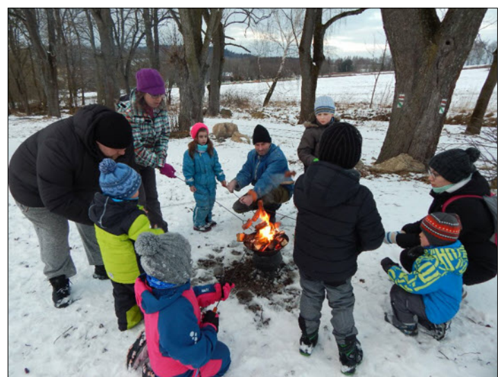
Společná akce MC Klubičko a Cvičení rodičů s dětmi “Radovánky na sněhu”