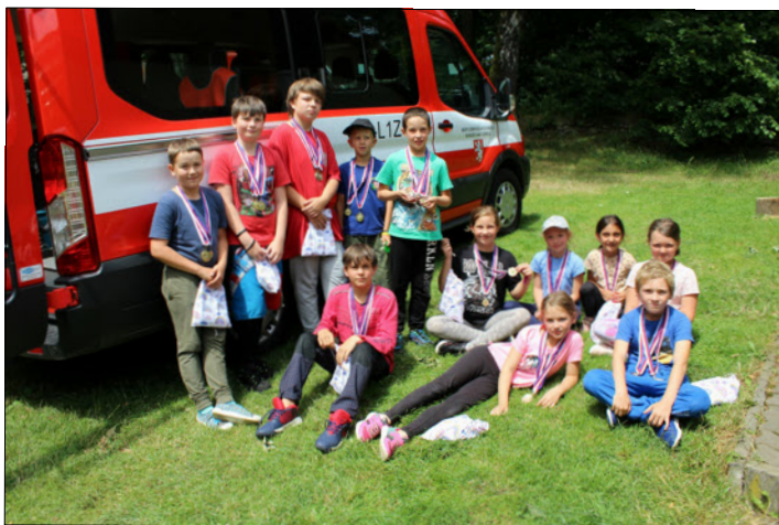
Mladí hasiči SDH Benešov nad Černou

Fotografie ze soustředění si můžete prohlédnout na https://sdhbc.estranky.cz/