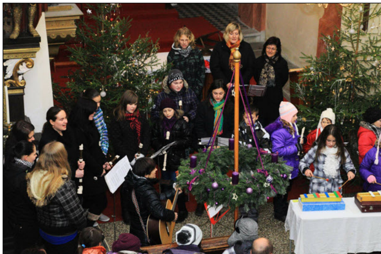
Vánoční zpívání flétnového souboru Sedmikrásky.