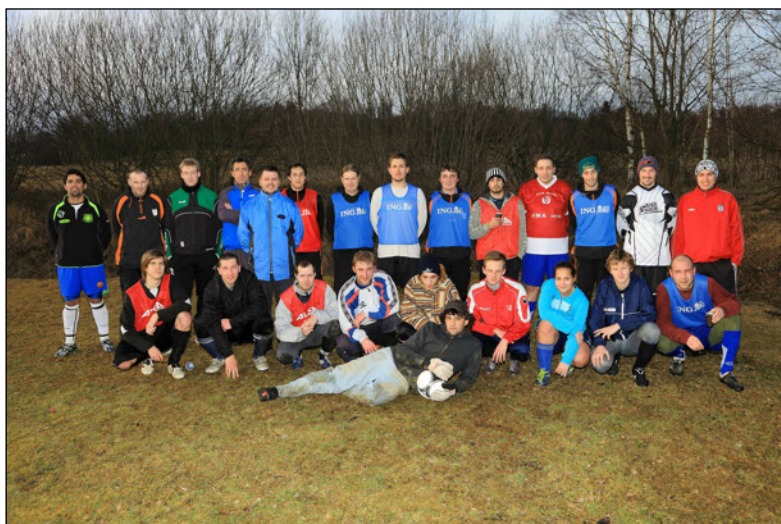
Silvestrovský fotbalový srandamač

Koupím les včetně pozemku, jakoukoliv výměru. Platba v hotovosti. Vstřícné a solidní jednání. Tel. 724 086 157