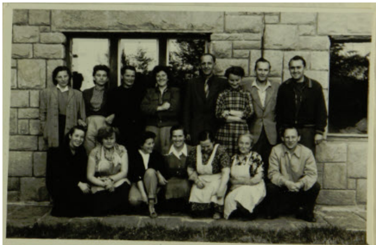
Učitelský sbor osmileté střední školy v Benešově nad Černou