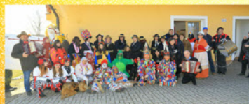
SDH Benešov nad Černou a Obec Benešov nad Černou Vás srdečně zvou na