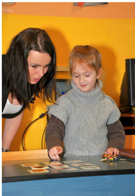
Zápis budoucích prvňáčků proběhl v ZŠ Benešov n.Č v pátek 25.ledna.

SDH a Obec Benešov nad Černou Vás srdečně zvou na