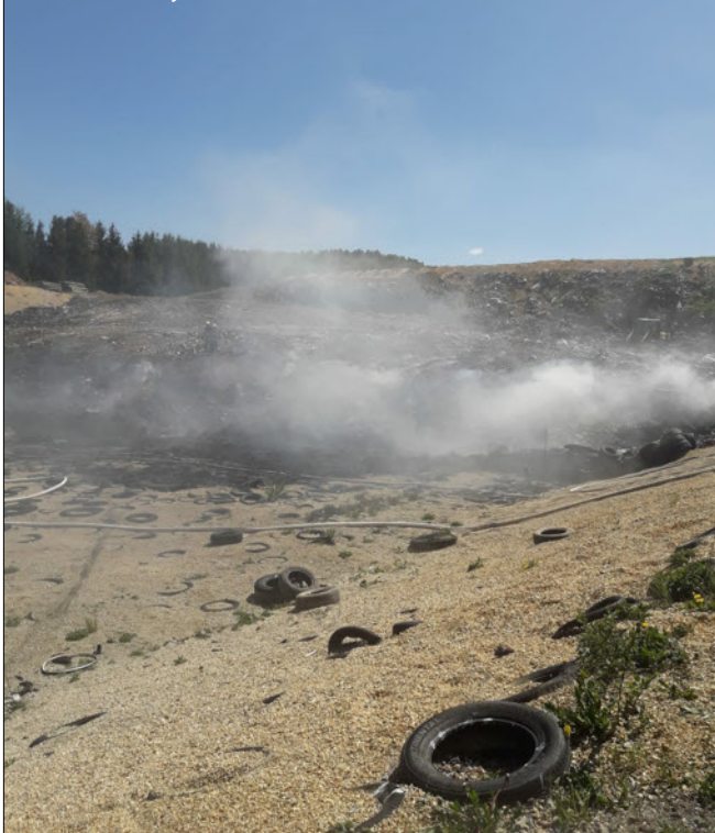
Požár skládky Bukovsko 7.5.2020

I když se osobně znáte s velitelem jednotky nebo se starostkou obce, ani jeden z nich nemůže vyslat jednotku k zásahu. Jednotka musí být povolána prostřednictvím systému KOPIS, na který jsou napojena výše uvedená čísla.