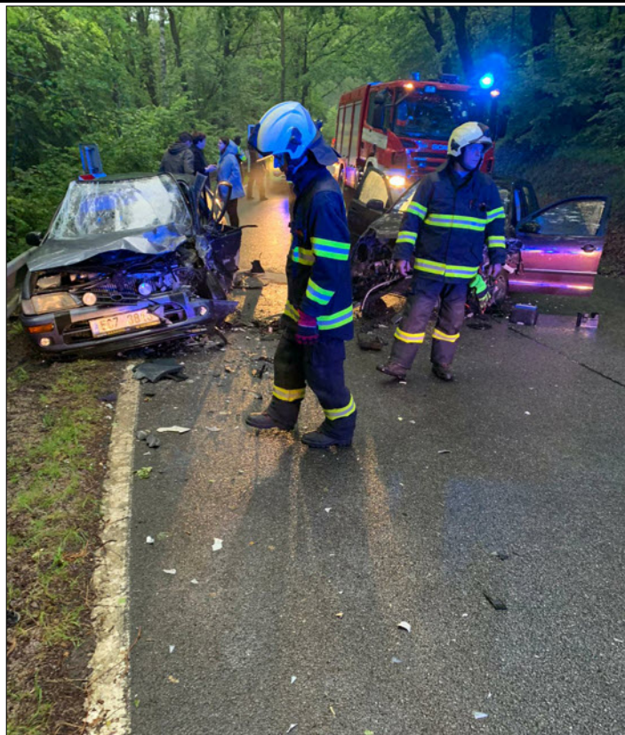
Dopravní nehoda před Benešovem 20.6.2020