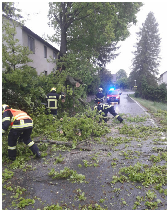
Spadlý strom - úklid 23.5. 2020