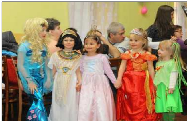
Dětský maškarní karneval 20.3.2010 na sále hotelu Černá

Do přistaveného vleku je možno vyhodit velkoobjemový odpad. Do vleku nepatří větve, listí a podobný odpad !!!! Kovový šrot ukládejte vedle vleku, bude odvezen zvlášť.