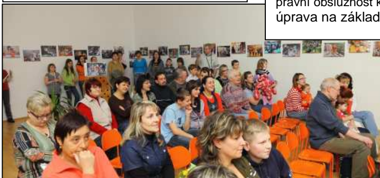
Zahájení výstavy fotografií „Jak se žije v mateřských centrech“ v Mateřském centru Klubíčko 11.3.2010