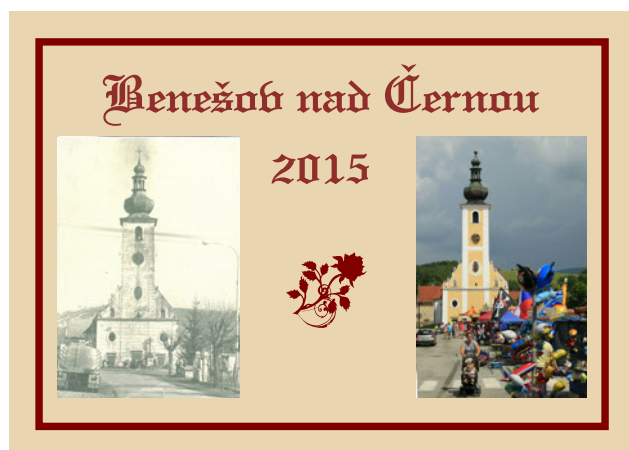
Kalendář na rok 2015 v prodeji v knihovně.